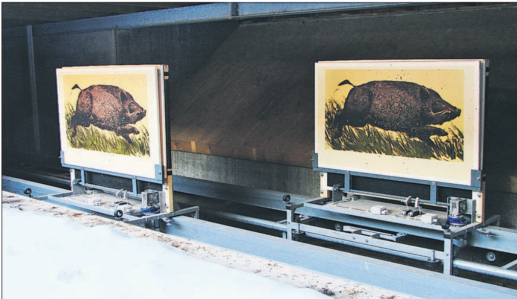
Die „Keilerscheiben“ können hintereinander, aber auch gegeneinander vor die Büchse des Schützen gebracht werden.